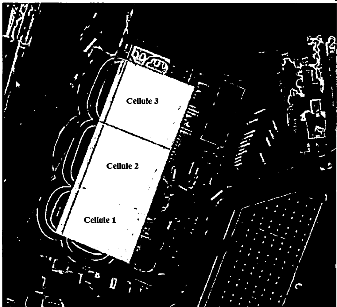
Figure 1 : Courbes enveloppes des scénarii d'incendie Extrait de l'étude de danger

« dans les zones exposées à des effets irréversibles, l'aménagement ou l'extension de constructions existantes sont possibles. Par ailleurs, l'autorisation de nouvelles constructions est possible sous réserve de ne pas augmenter la population exposée à ces effets irréversibles. Les changements de destinations doivent être réglementés dans le même cadre ».